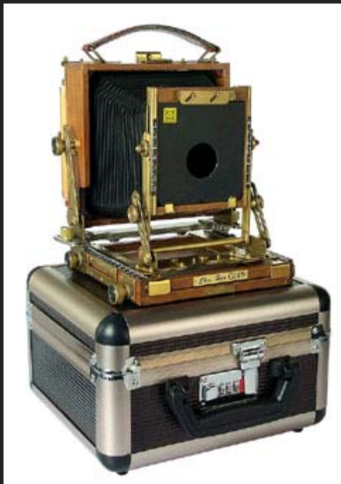
La GJ 45 è identica alla HZX 45-II A, ma non ha il soffietto intercambiabile.