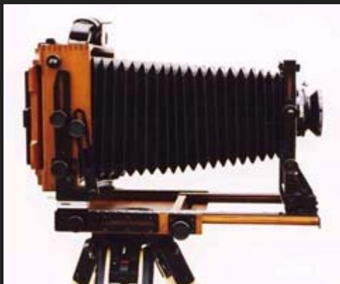
La macchina fotografata di profilo per mettere in luce le possibilità di estensione del soffietto.

In questo articolo esamineremo il modello a nostro avviso più interessante: la HZX 45-II A. Si tratta di una folding in legno di teck dotata di prestazioni estremamente accattivanti non solo in rapporto al prezzo, ma anche in assoluto, quali ad esempio il soffietto intercambiabile e il decentramento verticale del dorso, presente in pochissimi altri modelli di pari categoria.