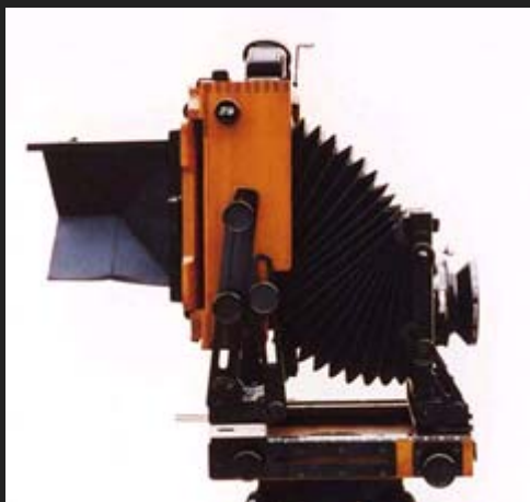
Il decentramento verso l'alto del dorso è una caratteristica che si ritrova in modelli di ben altro prezzo. Visibile in questa foto il paraluce pieghevole per il vetro smerigliato, un accessorio a nostro avviso inutile.

rendere disponibile anche un soffietto floscio. Una scelta che denota esperienza ed attenzione per le esigenze del fotografo.