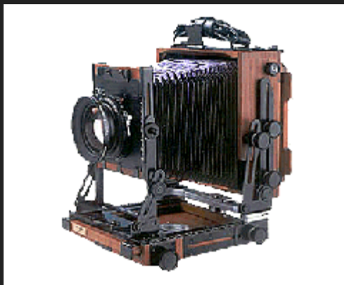
La Shen-Hao HZX 45-II A

La Cina è un grande drago che custodisce tesori. Il lavoro di un artigiano di Shangai si è trasformato con gli anni in una piccola impresa artigianale, la Shen-Hao Professional Camera Company, filiale della ben nota Seagull Camera Company. Qui si costruiscono, curandole una ad una, fotocamere folding estremamente interessanti sia per le prestazioni che per il prezzo.