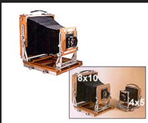
Il modello 8x10" e, in basso a destra, il confronto dimensionale con la HZX 45-II A.

soffietto intercambiabile. Shen-Hao produce anche una camera in legno 4x5 pollici non pieghevole particolarmente adatta all'uso di ottiche grandangolari e due modelli 8x10 pollici, rispettivamente con e senza soffietto intercambiabile.