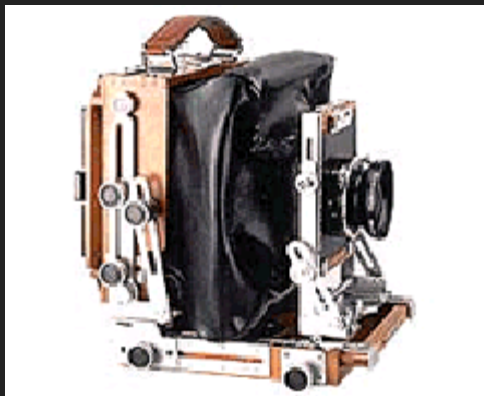
La Shen-Hao HZX 45-II A equipaggiata con il soffietto grandangolare.